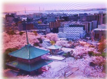
桜が満開の孝道山