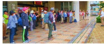
東神奈川駅東口広場