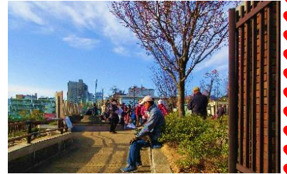
鷺沼ふるさと広場