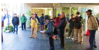
大山街道ふるさと館