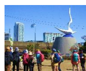
岡本かの子文学碑