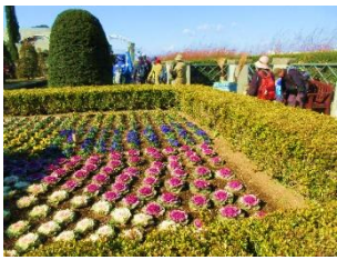
山手イタリア山庭園