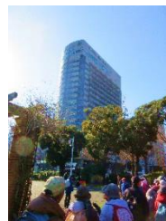
ホテルニューグラウンド