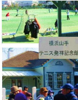
横浜山手テニス発祥記念館