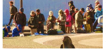
横浜公園にてスタンプ