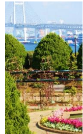
港の見える丘公園