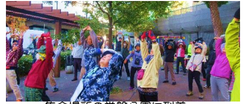
集合場所の常盤公園に到着