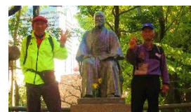
高橋是清翁記念公園