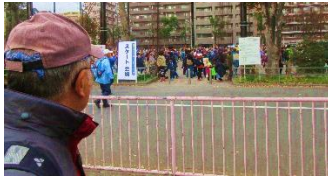
600人のウォーキング