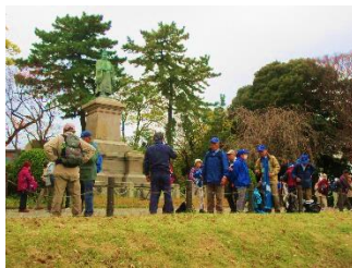
掃部山公園にて表彰式