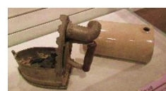
アイロンと湯たんぼ