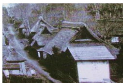
明治4年頃の下鶴間宿