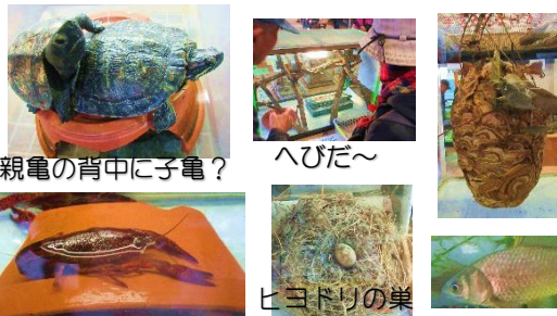
親亀の背中に子亀?