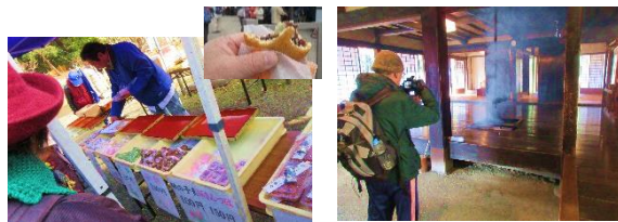
和菓子が色々あるぞ! 燻っている。虫除けかな?