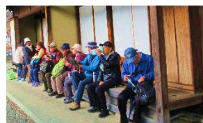
市下鶴間ふるさと館