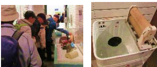
市つる舞の里歴史資料館