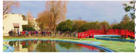
菊名池公園プール