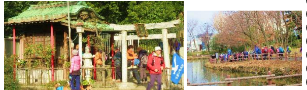
① 菊名池弁天(弁財天)