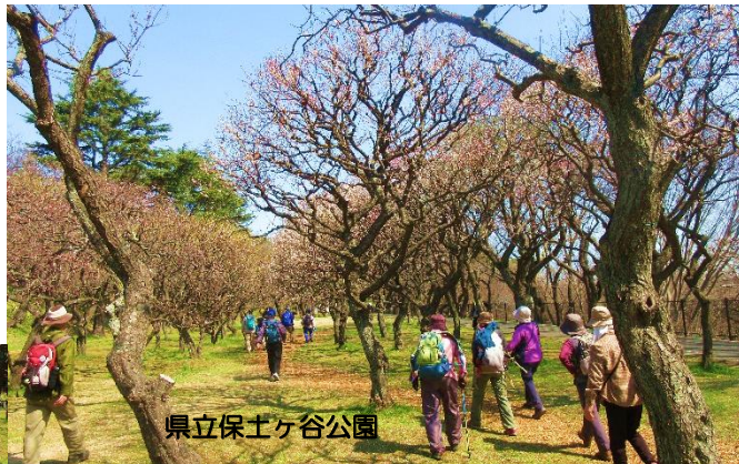
県立保土ヶ谷公園