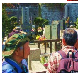
美空ひばりさんのお墓