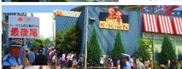
アンパンミュージアム