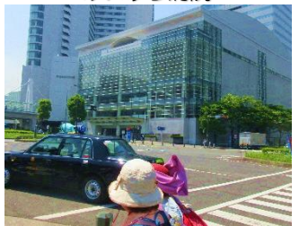
みなとみらいホール