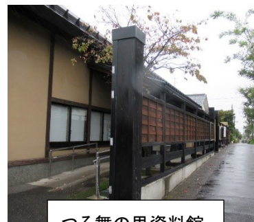
つる舞の里資料館

～ 泉の森 ～ 大和市郷土民家園 ～ 下鶴間ふるさと館 ～ つる舞の里歴史資料館 ～ つきみ野駅