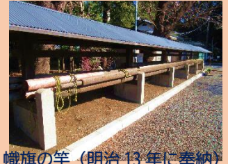
幟旗の竿(明治13年に奉納)