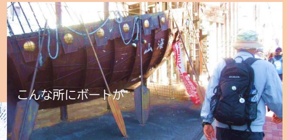
こんな所にボートが

昨夜、スマホの津波注意報が鳴りっぱなしで皆さんさぞかし睡眠不足でしょう。私のスマホは19回の津波警報と朝方千葉南方沖で緊急地震速報が2回メールされてました。午後2時頃に解除されホッとしました。