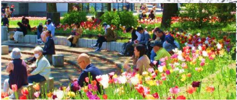
JR関内駅・地下鉄関内駅