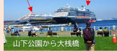
山下公園から大栈橋