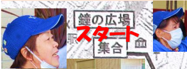
鐘の広場 スタート 集合