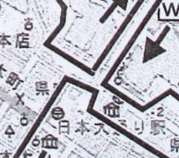
大さん橋ターミナル