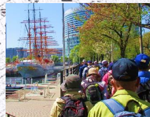
日本丸メモリアルパーク