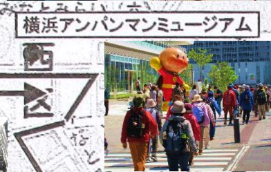
横浜アンパンマンミュージアム