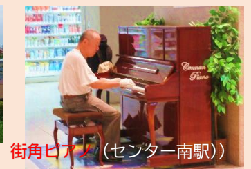
街角ピアノ(センター南駅)