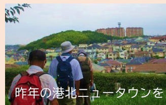
昨年の港北ニュータウンを見下ろすコース